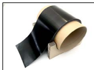
DICARBO ® LF のイメージ