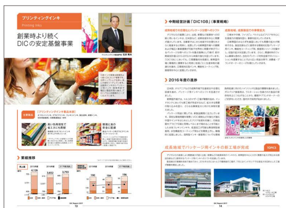
カラーユニバーサルデザインを採用した視認性の高いデザイン

DIC レポートは、より多くの方のニーズに応えるため、要点を簡潔にまとめたハイライト版（冊子およびPDF）と、より詳しい情報やデータを盛り込んだ詳細版（PDF）を発行します。ハイライト版では、当社ウェブサイトのサステナビリティページとの連携を強化するため、関連URLを記載するとともに、タブレットPCやスマートフォンからアクセスしやすいようにQRコードを併記しています。なお、レポートの作成にあたっては、ガイドラインとして「ISO26000:2010」「レスポンシブル・ケア・コード」に加えて、昨年からはレポートの国際基準となっている「GRIガイドライン第4版」※2を採用し、ステークホルダーの皆様が必要とされる情報を提供していくよう心がけています。