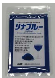
「リナブルー®」（パッケージは変更になる場合があります）

会期中には、スーパーフードに関するセミナーも開催され、当社社員がグローバルに拡大する天然系色素の需要動向などについてお話しします。