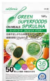
「スーパーフード スピルリナパウダー ON-MEALS」

同社では、スピルリナを栄養補助食品として約40年の長きにわたり展開してきたことに加え、レストランや菓子店の食品素材としても提供するなど、現在のスーパーフードブームに先駆け、市場での価値・認知度を高めてきました。このたびの展示では、最近、スムージーやふりかけなどに混ぜて手軽に摂取できると話題の「スーパーフード スピルリナパウダー ON-MEALS」もご紹介いたします。