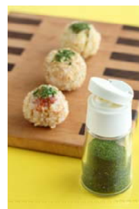
スピルリナパウダーを使用したふりかけ

また、スピルリナから抽出し、天然系青色素として米国食品医薬品局（FDA）に初めて認可された“フィコシアニン”を商品化した「リナブルー®」を初出品し、お菓子や飲み物の調理例とともにご紹介いたします。