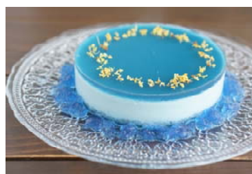
リナブルー®を使用したケーキ