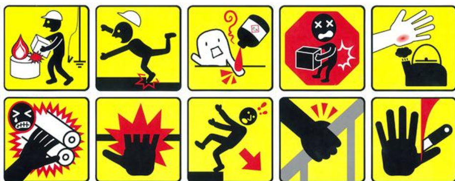
グループ社員がデザインした安全注意喚起ステッカー

今後もDIC グループ一丸となってRC活動を推進し、ゼロ災害達成に向けて更に安全活動を活発化させていく所存です。