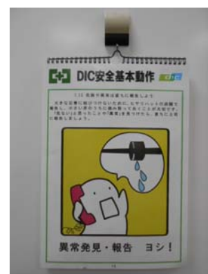
DIC 安全基本動作輪読版

※ 化学工業界において、化学物質を扱うそれぞれの企業が化学物質の開発から製造、物流、使用、最終消費を経て廃棄・リサイクルに至る全ての過程において、自主的に「環境・安全・健康」を確保し、活動の成果を公表し社会との対話・コミュニケーションを行う活動