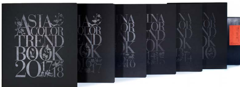
カラートレンドブック 2009 年-2018 年表紙

同社は、2008 年に中国の社会背景や価値観から読み解くトレンド動向と、最先端のアーティストやブランドのクリエイションにいち早く着目、分析を進め、中国を起点とする世界唯一のカラートレンドブック「中国カラートレンドブック」を創刊、2014 年からは対象地域をアジアに広げて「アジアカラートレンドブック」を刊行しています。アジアを起点としたデザイントレンドを色や素材、言語、ビジュアルなど多面的に読み解いた資料は他にないため、本書はブランド戦略に携わるクリエイティブ関係者をはじめ、マーケティングの担当者などに幅広く支持されています。