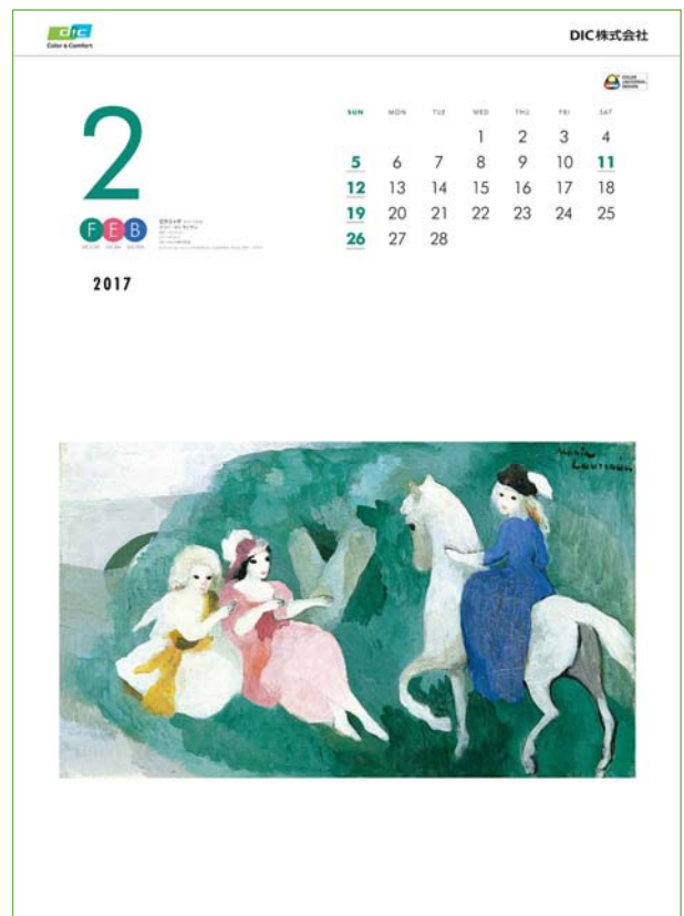
2017年 DIC オリジナルカレンダー 「Color & Comfort」(表紙、2月、7月)